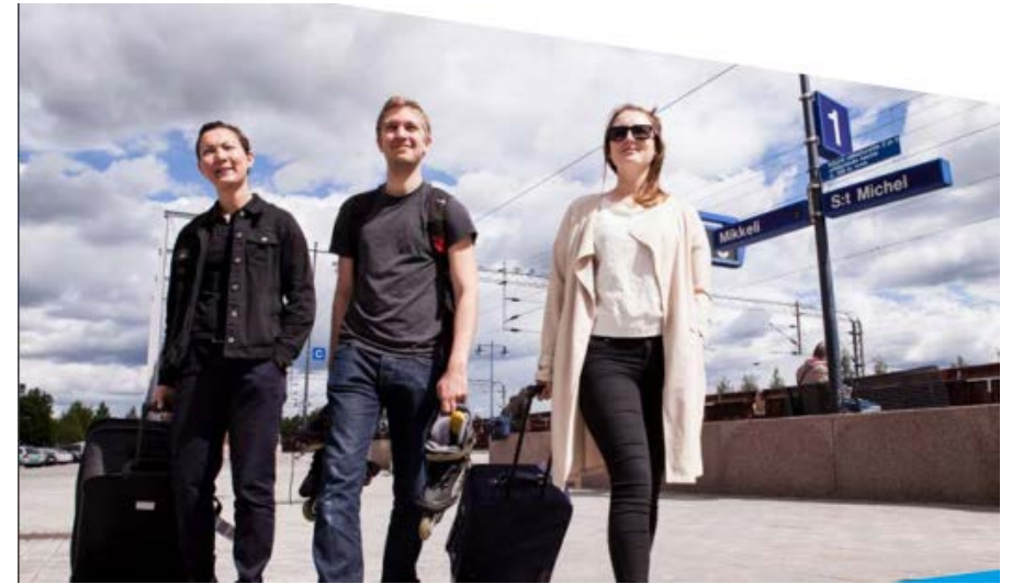
MIKKELIN AMMATTIKORKEAKOULU Mikael University of Applied Sciences