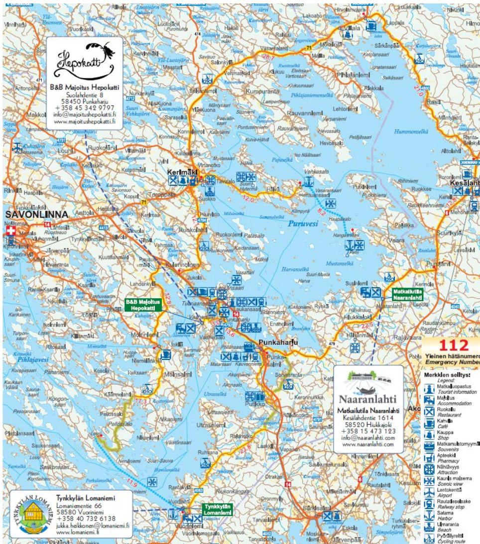
KUVA 1. Pyöräilyreitien majoituskohteet kartalla.

Tarkasteltava retki on kestoltaan kolme vuorokautta ja sisältää yöpymiset aitta-/huonemajoituksessa tai pienessä mökissä. Majoituspaikat ovat Hepokatti, Tynkkylän Lomaniemi ja Naaranlahti Punkaharjulla. Majoituskohteiden sijainti on nähtävissä kuvassa 1.