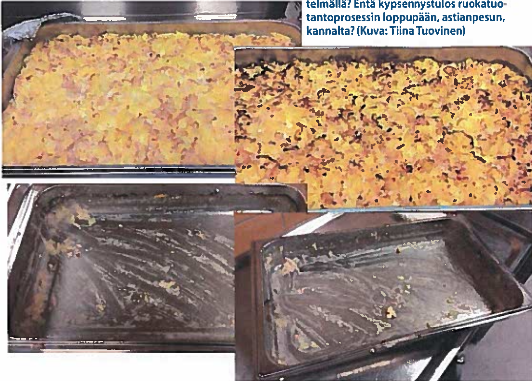
Kuva 1. Tummempaa vai vaaleampaa kinkkukiusausta? Millä kypsennysmenetelmällä? Entä kypsennystulos ruokatuantoprosessin loppupään, astianpesun, kannalta?

Osaltaan työhyvinvoinnin tehostamisen mahdollisuudet liittyvät keittiötekniikan vahvempaan käyttöön ottamiseen. Nykyään ammattikeittiölaitteet sisältävät suuren määrän ns. älytoimintoja, joiden tarkoitus on yksinkertaistaa ja samalla tehostaa ja helpottaa ammattikeittiössä tapahtuvaa ruoanvalmistusta (kuva 1). Älytoimintoja ovat esimerkiksi laitteiden valmiit kypsennysprosessit, joiden avulla vaikkapa lasagne kypsyy meheväksi, koska uunin lämpötila, kosteus ja kypsennysaika on säädetty ihanteelliseksi. Ammattikeittiölaitteisiin voidaan tallettaa muistiin myös ammattikeittiön omia valmistusprosesseja. Lisäksi ammattikeittiölaitteita voidaan ajastaa aloittamaan vaikkapa puuronkeitto aamulla ennen henkilökunnan saapumista.