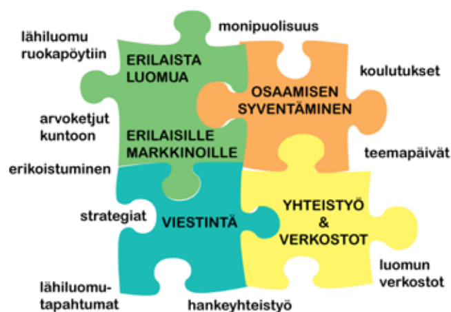
Kuva 2. Alkukartoituksen perusteella muotoillut luomun kehittämispolut limittyvät toisiinsa.