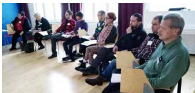
Kuvat 5 ja 6. Miniseminaarien yleisöä Kouvolassa ja Lappeenrannassa syyskuussa 2019.