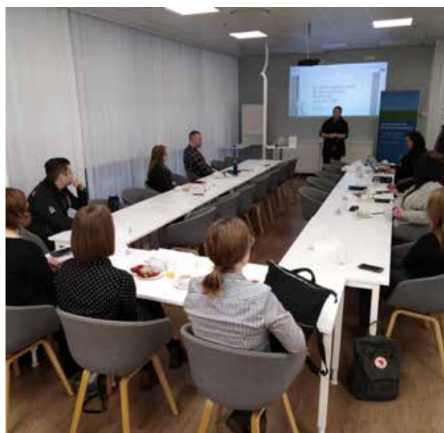
Kuva 7. Paikallisuus ja luomu ovat tärkeässä roolissa matkailuun kehitettävien elämysten suunnittelussa. Asiaa pohdittiin Kouvolassa tammikuuisessa työpajassa.

Suurin osa tilaisuuksista pystyttiin järjestämään suunnitellusti, mutta koronaviruksen aiheuttaman poikkeustilanteen vuoksi keväälle ja kesälle 2020 suunnitellut tapahtumat jouduttiin pääsääntöisesti perumaan. Poikkeustilanne sekä yrittäjien aika- ja resurssipula poikkeustilanne