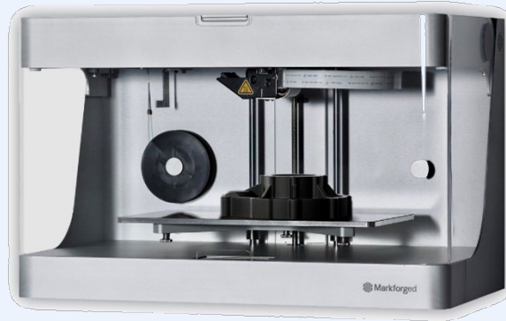
MARKFORGED MARK TWO