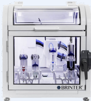
BRINTER® 3D BIOPRINTER