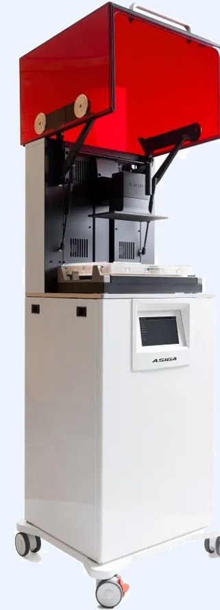
ASIGA PRO 4K65 tulossa 12/20