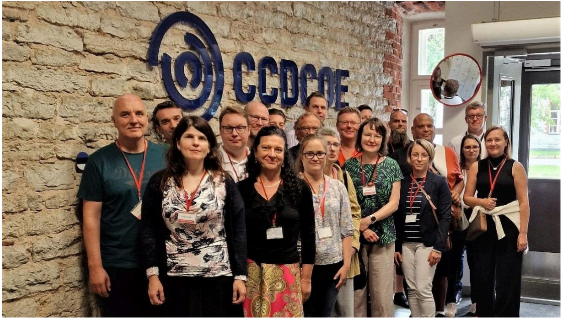
Kuva: Xamkin ja TalTechin vierailulla Tallinnan NATO CCDCOE -kyberturvallisuuskeskuksessa