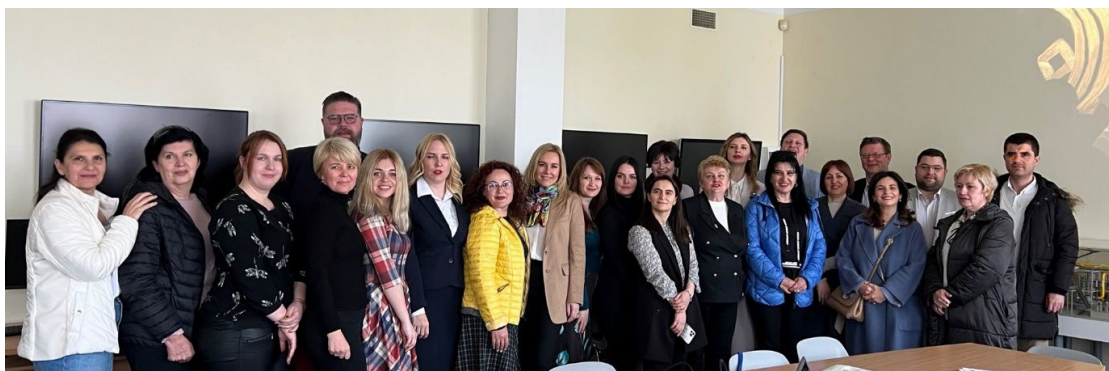
Kuva: Xamk vierailulla Latvian Maritime Academyssä 23.-25.4.2023